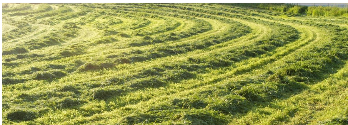
Bilde 16 Smittevernplanen skal omfatte alle deler av driften. Sjekker du opprinnelse og kvalitet på innkjøpt fôr?

En smittevernplan kan være nyttig i arbeidet med å hindre smitte til egne dyr og til besøkende i dyreholdet, også i dyreparker og sirkus, og ikke minst på besøksgårder, der de besøkende har tettere kontakt med dyra på gården.